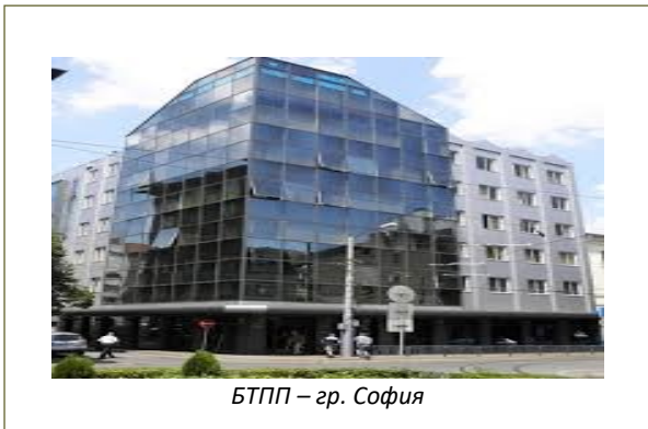
БТПП – гр. София

Съветът по иновации при БТПП организира кръгла маса на тема "Финансовите инвеститори в подкрепа на иновативните стартъпи и МСП, учредени от студенти и младежи".