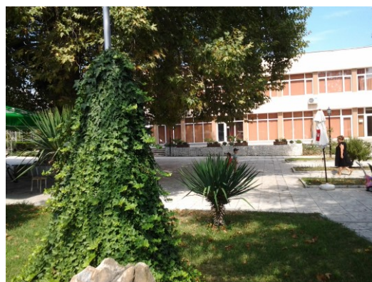
НЧ „Братя Миладинови - 1946“, с. Микрево

Ако на първо четене не се сещате, можете да се разровите из контактите, с които разполагате в социалните мрежи. LinkedIn е едно добро място за намиране на опитни хора в сферата на вашия бизнес.