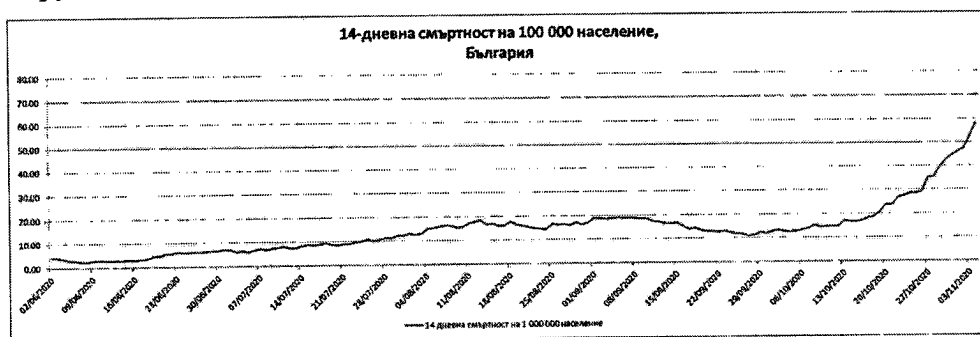
Фиг.2: 14-дневна смъртност от COVID-19 на 100 000 население в България.

- Неблагоприятна тенденция се отчита и спрямо броя на починалите от новия коронавирус лица.